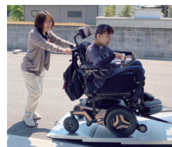
スロープ付きだから、車両の乗り降りがスムーズ

香川県の社会福祉向上を目指し、福祉車両などを寄附する『香川県応援ファンド』。生活介護と就労継続支援B型の障がい福祉サービスを行う施設チーム様からは「車両が増えたことで、行動範囲が広がった」と喜びの声をいただいています。家庭と施設をつなぐだけでなく、社会へ可能性を開いていく。そんな希望を乗せて、車両は今日も香川県のあちこちを走っています。