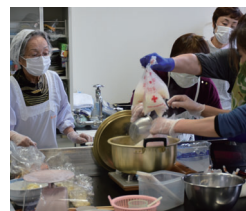
赤十字ボランティアによる災害時の炊き出し

『福井県応援ファンド』では毎年、日本赤十字社福井県支部へ活動資金として寄附を行っています。赤十字は中立・公平な立場であるがゆえ、国などからの公的な支援を受けていません。応援ファンドによる継続的な支援は、いつ起きるか分からない災害に備え、地域の暮らしを守るという大切な役割を果たしています。