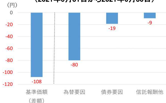
【図表1】「中国人民元ソブリンオープン」の基準価額の要因分析 (2021年5月31日から2021年6月30日)

※ 上記の数値は、日々の基準価額の変動を簡便法で計算し累積した概算値です。このため、必ずしも基準価額の変動を正確に示したものではありません。