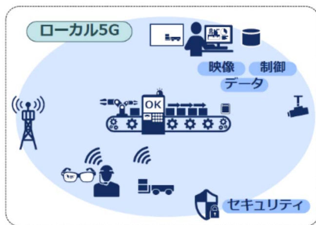
【図表2】 工場での5G活用のイメージ

当ファンドでは、こうしたインフラ投資の変化にも着目して個別銘柄の選定を行い、パフォーマンスの向上を目指してまいります。