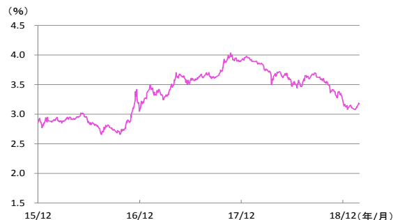
【図表3】中国の10年国債利回りの推移 (2015/12/31～2019/2/28)