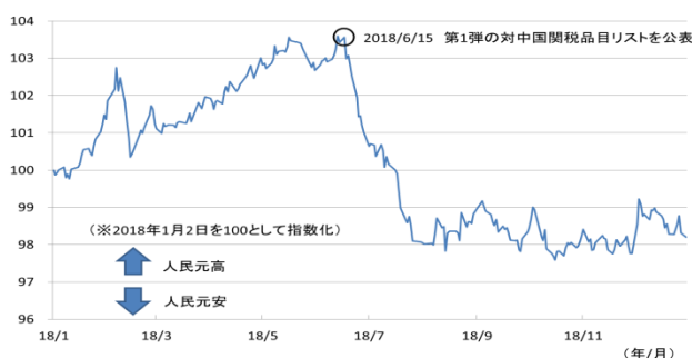
【図表1】人民元の名目実効為替レートの推移 (2018/1/2~2018/12/31)